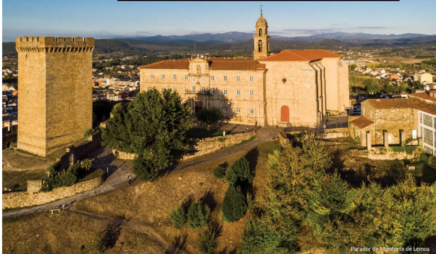
Parador de Monforte de Lemos

Descuento aplicable exclusivamente sobre la Tarifa Parador vigente en cada momento, en régimen de alojamiento y desayuno