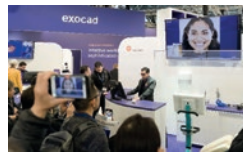
Los asistentes mostraron un gran interés por la presentación de TruSmile Video y la aplicación de escaneado facial en 3D.

exocad anunció múltiples ofertas de nuevos productos y servicios, dos descuentos en software por tiempo limitado y una gama completa de actividades de formación en directo para los asistentes a la International Dental Show (IDS) 2023. Con 11 estaciones de demostración y sesiones de diseño de sonrisa en directo cada hora, exocad invitó a los asistentes a imaginarse las posibilidades del software CAD bajo el lema "Imagine the CADabilities" y descubrir sus numerosas soluciones de software para laboratorios y clínicas en el stand de la empresa en el pabellón 1 de la Feria de Colonia. La Smile Creator Experience de exocad –una demostración en directo paso a paso sobre cómo utilizar Smile Creator – fue una de las atracciones principales.