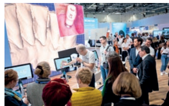
Miles de visitantes pasaron por el stand de Align durante la celebración de la IDS.

Align Technology estuvo más presente que nunca en la IDS, con un stand interactivo que mostró la cartera completa de productos y servicios dentro de la Plataforma Digital Align™, el conjunto integrado de tecnologías y servicios patentados entregados como una solución integral sin fisuras para los clientes. Align presentó la experiencia de tratamiento integral Align Digital Workflow, basada en el sistema Invisalign® y los escáneres intraorales iTero™.