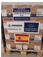
Cerca de 7,2 toneladas de medicamentos foram enviados para as vítimas do terramoto.