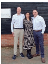
Acionistas do grupo Corus no Reino Unido.